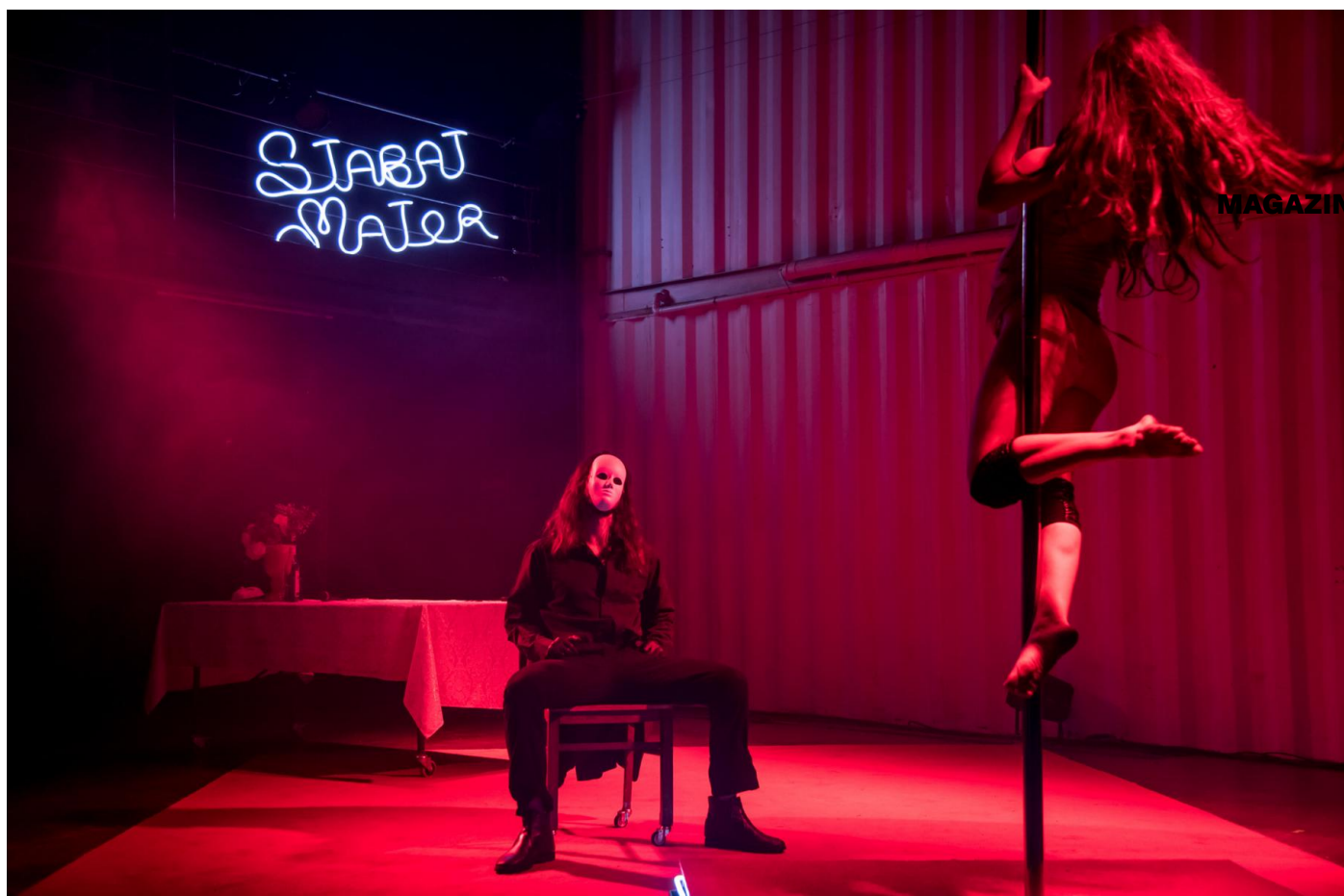
Stabat Mater de Janaina Leite

SOCIÉTÉ SCÈNES ARTS PHOTOGRAPHIE LITTÉRATURE CINÉMA MUSIQUE AGENDA